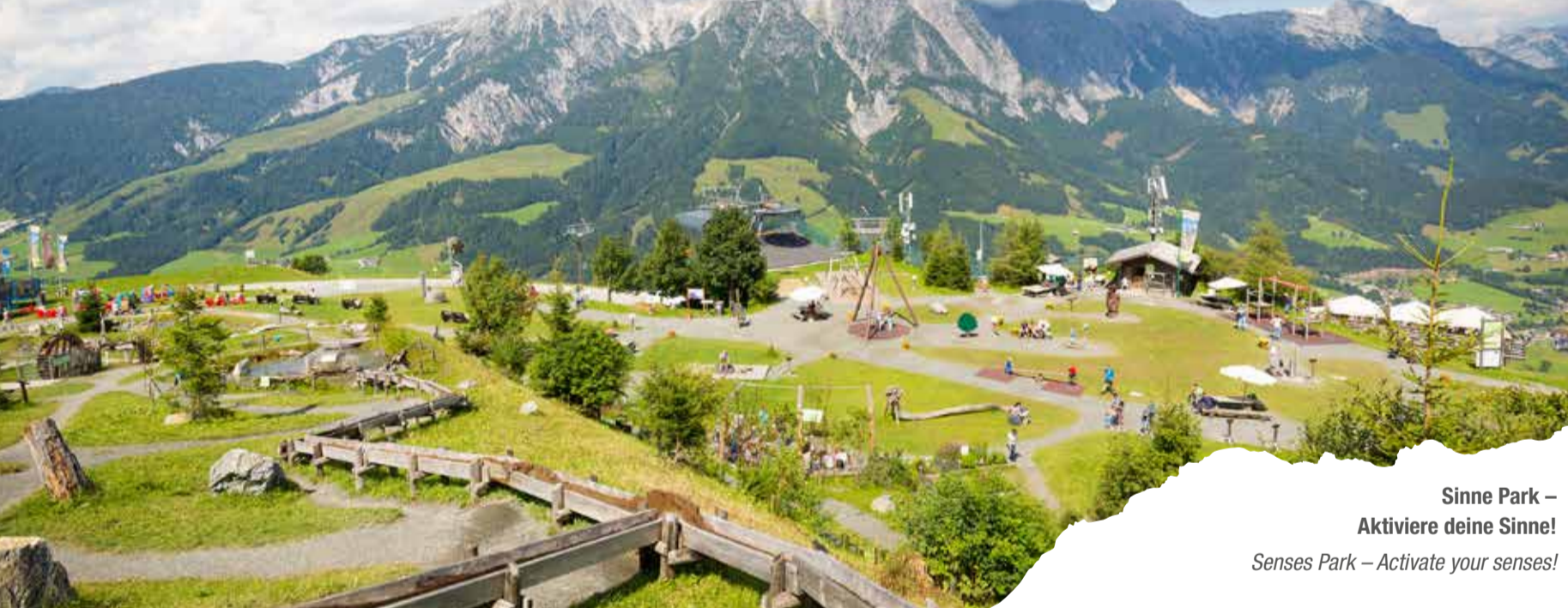
Sinne Park – Aktiviere deine Sinne! Senses Park – Activate your senses!